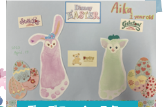
ディズニーイースター