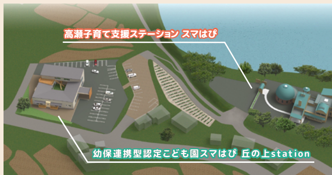
▲↑完成予定図。幼保連携型認定こども園(左)と高瀬子育て支援ステーション スマはぴ(右)が今年新設されます。

スマイル・ステーショングループが手掛ける社会福祉法人「笑愛会(しょうあいかい)」。いよいよこの4月から本格始動です！ 三豊市高瀬町にて、地域の子育て拠点となる「高瀬子育て支援ステーションスマはぴ」が4月10日にオープンする運びとなりました。 子育て支援ステーションとは、0歳～就学前までの乳幼児とその保護者を中心に様々な活動を通して親子の触れ合い、子ども同士の触れ合い、保護者同士の触れ合いを目的とした施設です。地域の子育てアドバイザーとして、子育て奮闘中のお父さん・お母さんが安心して育児に取り組んでいけるように支援していきます。また、9月には「幼保連携型認定こども園スマはぴ 丘の上station」も開園予定です。この高瀬町から子育てに関する情報を発信し、子育てに関わる全ての方が頼れる存在となれるようこれから邁進してまいります。