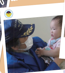
交通安全教室 【警察署の皆様】