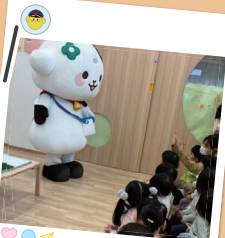
食育イベント 【ミルクム南様withみるぼん】