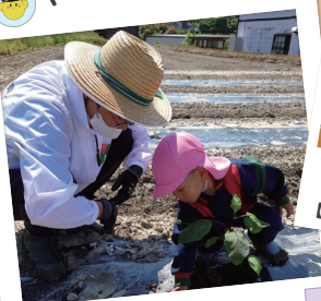
園の畑で菜園活動！ 【JAの皆様】