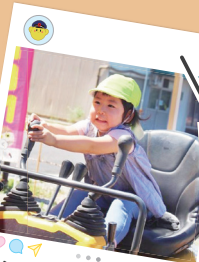
シヨベルカー乗車会 【ユニバーサルホーム丸亀様】